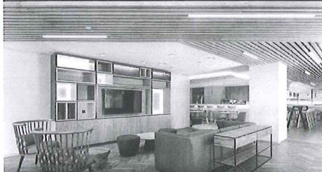
HOLIDAY INN LISBOA ★★★★