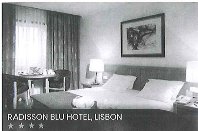
RADISSON BLU HOTEL, LISBON ★★★★