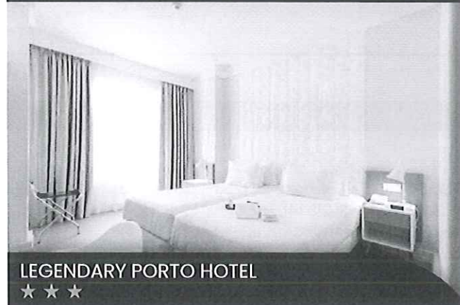
LEGENDARY PORTO HOTEL ★★★★