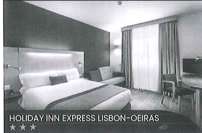
HOLIDAY INN EXPRESS LISBON-OEIRAS ★★★★