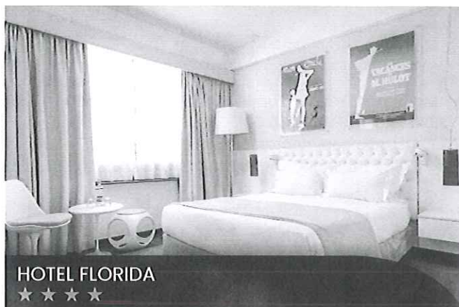
HOTEL FLORIDA ★★★★